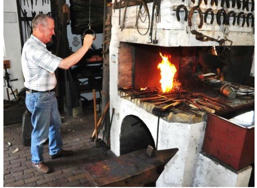
Helpen bij de smid.