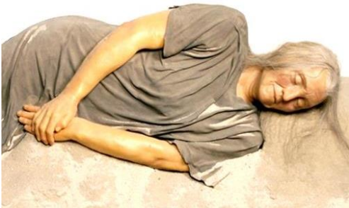
In het museum ligt een wassen beeld van Trijntje.