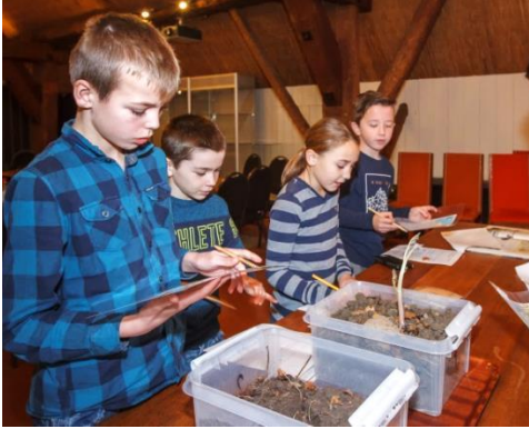
Op ontdekking in het museum.

In de grote tuin achter het museum is van alles te zien over de geschiedenis van de natuur en een boerenerf, met een boomgaard, grienden, stukjes weiland en veel meer. Tijdens een tuinwandeling kom je veel tegen. Kom het allemaal beleven.