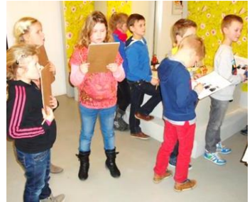
Een speurtocht bij een expositie.

Dit uitje kost € 6,- p.p. en je moet tijdig reserveren.