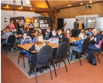
Les in het museum.

Een lesprogramma bestaat uit een rondleiding door het oude deel van het museum, eventueel aangevuld met een bezoek aan de smid, de hoepelmaker of de expositie van dat moment. Dit lesprogramma kost € 3,- per leerling. Wacht niet te lang met reserveren. Educatieve lessen worden van 1 september t/m 31 mei gegeven