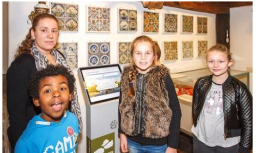
Er zijn digitale informatiezuilen.