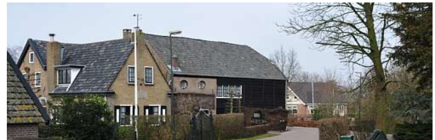
'De Verkeerde Wereld'