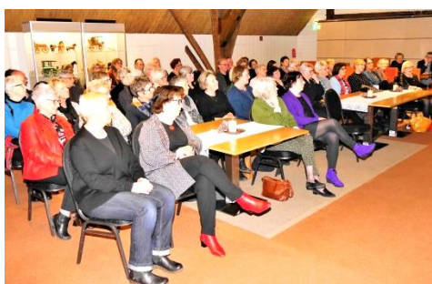
Zoveel mensen op De Etage als bij de opening van Duizend Speldenprikken kan voorlopig niet.

Het heeft even geduurd en er was nogal wat energie nodig. De krant noemde het 'eerste hulp' en dat er grote druk nodig was. Maar er is nu toch 300 miljoen toegezegd voor de culturele sector. Dat zal hard nodig zijn, want wat deze sector in lange tijd heeft opgebouwd dreigde in luttele weken in elkaar te zakken. Of er ook voor ons wat inzit weten we nog lang niet; cultuur is een heel brede sector.