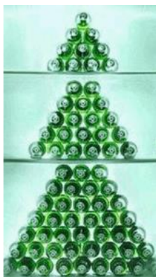
Kerstboom voor dorstige types...

Het werk op de voorzolder vordert gestaag.