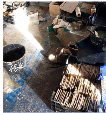
Alle tegels gaan in kratten naar de werkplaats voor het vervolgprocedé.