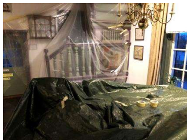
Afgedekt om het te beschermen tegen het stof. Nodig was het niet.