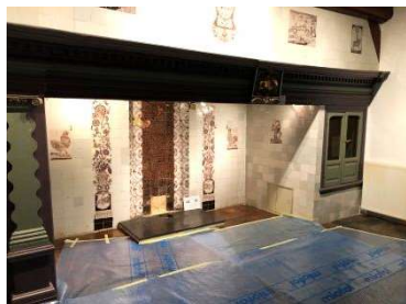
Dinsdag 04.01.2022 nog wel in tact, maar helemaal leeggehaald.