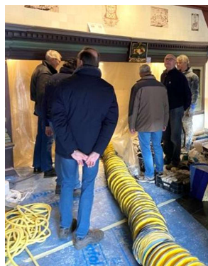
En soms was er veel belangstelling op de werkplek