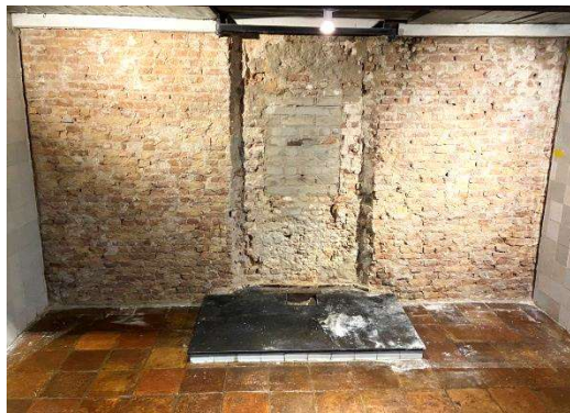
Deel één van het werk zit er op; de plek van het oude stalraampje is goed te zien in het metselwerk.