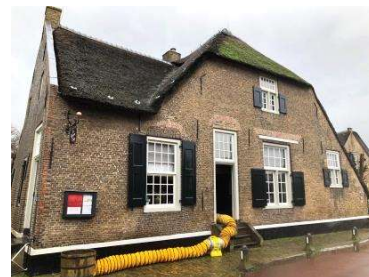
Luchtafvoer voor een verantwoorde en werkbare werkplek.